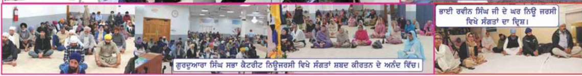
ਗੁਰਦੁਆਰਾ ਸਿੰਘ ਸਭਾ ਕੇਟਰੀਟ ਨਿਊਜਰਸੀ ਵਿਖੇ ਸੰਗਤਾਂ ਸ਼ਬਦ ਕੀਰਤਨ ਦੇ ਅਨੰਦ ਵਿੱਚ।