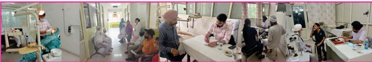
ਸੰਤ ਵਰਿਆਮ ਸਿੰਘ ਮੈਮੋਰੀਅਲ ਹਸਪਤਾਲ ਰਤਵਾੜਾ ਸਾਹਿਬ ਵਿਖੇ ਅੱਖਾਂ ਤੇ ਦੰਦਾ ਦੇ ਕੈਂਪ ਦਾ ਦ੍ਰਿਸ਼।