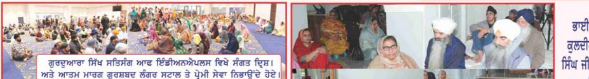
ਗੁਰਦੁਆਰਾ ਸਿੰਘ ਸਤਿਸੰਗ ਆਫ ਇੰਡੀਅਨਾਪੋਲਸ ਵਿਖੇ ਸੰਗਤ ਦ੍ਰਿਸ਼। ਅਤੇ ਆਤਮ ਮਾਰਗ ਗੁਰਸ਼ਬਦ ਲੰਗਰ ਸਟਾਲ ਤੇ ਪ੍ਰੇਮੀ ਸੇਵਾ ਨਿਭਾਉਂਦੇ ਹੋਏ।