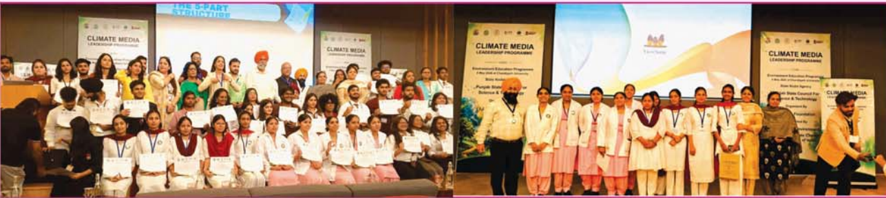
ਟਰਸਟ ਰਤਵਾੜਾ ਸਾਹਿਬ ਦੇ ਬੀ.ਐਡ ਕਾਲਜ ਅਤੇ ਨਰਸਿੰਗ ਸਕੂਲ ਦੇ ਬੱਚੇ, ਚੰਡੀਗੜ੍ਹ ਯੂਨੀਵਰਸਿਟੀ ਵਿੱਚ ਵਾਤਾਵਰਣ ਦੇ ਸਬੰਧ ਵਿੱਚ ਹੋਏ ਸੈਮੀਨਾਰ ਵਿੱਚ ਸ਼ਿਰਕਤ ਕਰਦੇ ਹੋਏ।